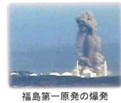
福島第一原発の爆発